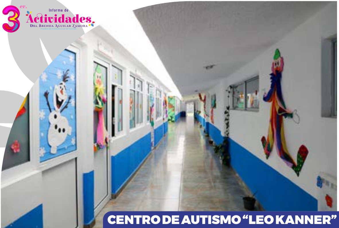
CENTRO DE AUTISMO “LEO KANNER”