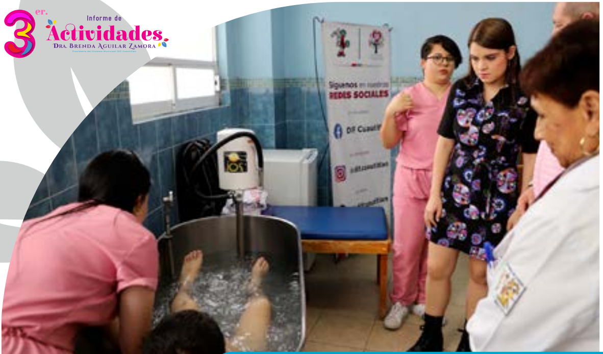
U.R.I.S. Rehabilitación de tinas de hidromasaje.